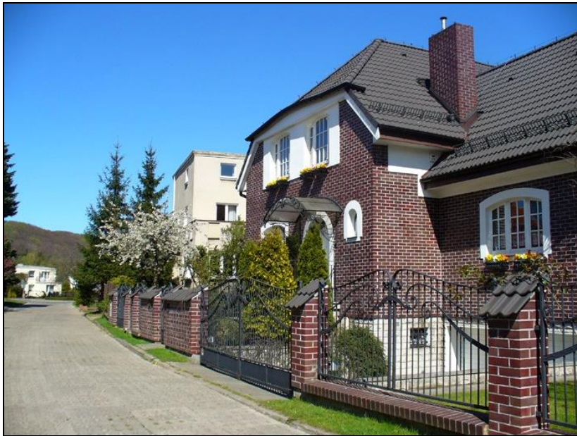
Ryc. 2. Zabudowa jednorodzinna w Gdyni Orłowie (06 czerwca 2016)